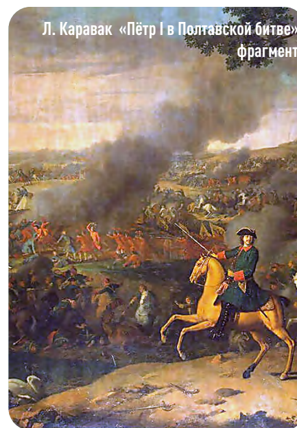
Л. Каравак «Пётр I в Полтавской битве» фрагмент

После этих событий Петр предложил королю Швеции Карлу XII заключить мир, однако это предложение было отвергнуто. Великая Северная война продолжилась. В 1706 году Карл начал поход на Россию. Он захватил Минск и Могилёв, получил поддержку от гетмана Малороссии Мазепы. Но продолжив движение на юг, войско лишилось и обоза с боеприпасами и подкрепления. Это произошло из-за того, что корпус Левенгаупта, шедший на соединение с Карлом, был разбит армией под началом генерал-губернатора Петербурга и близкого друга Петра Александра Меншикова 28 сентября 1708 года. А менее чем через год произошла, пожалуй, самая известная битва Северной войны – Полтавская, в ходе которой войско Карла XII потерпело сокрушительное поражение. Это произошло 27 июня 1709 года. Правитель Швеции вместе с гетманом Мазепой бежали в турецкие земли, после чего в войну вступила Османская империя, к 1711 году возвратившая себе Азов. В следующем выпуске вы узнаете об итогах Северной войны.