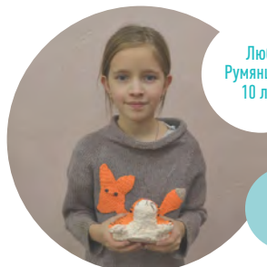
Люба Румянцева, 10 лет