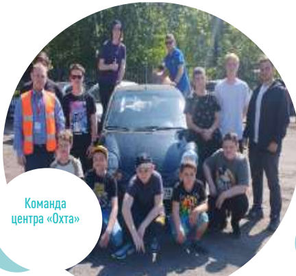
Команда центра «Охта»