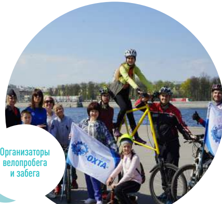
Организаторы велопробега и забега