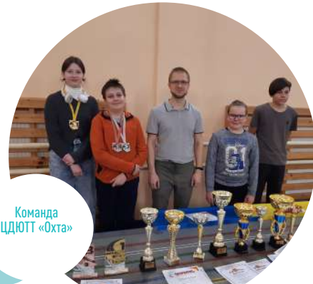
Команда ЦДЮТТ «Охта»