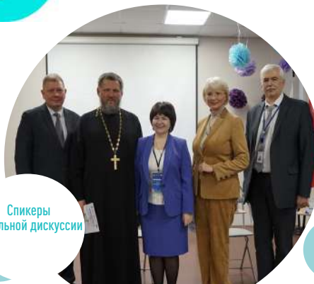
Спикеры панельной дискуссии