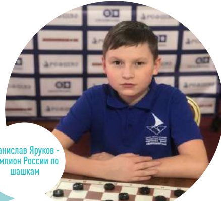
Станислав Яруков - чемпион России по шашкам