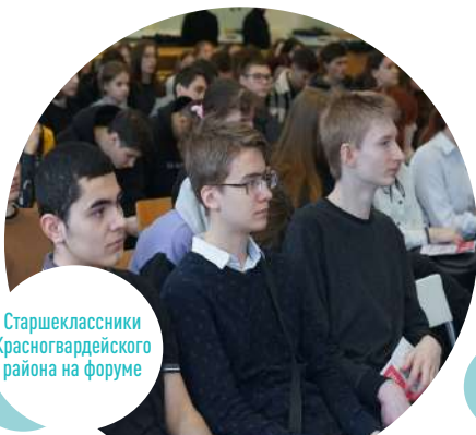
Старшеклассники Красногвардейского района на форуме