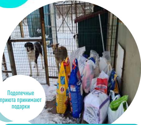
Подопечные приюта принимают подарки