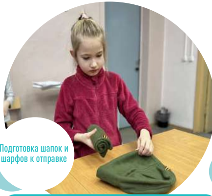
Подготовка шапок и шарфов к отправке