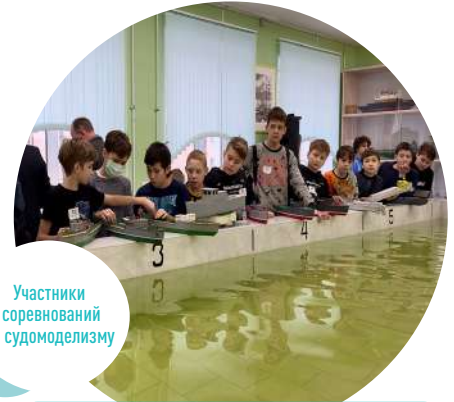
Участники соревнований по судомоделизму