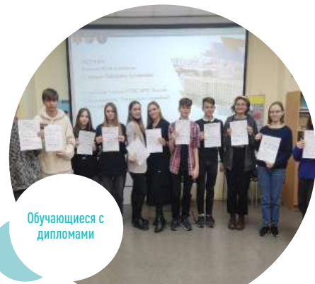
Обучающиеся с дипломами