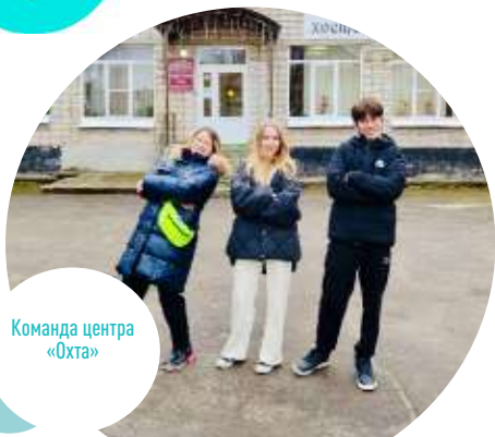
Команда центра «Охта»