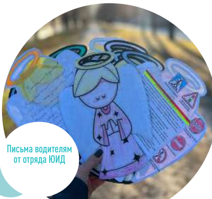
Письма водителей от отряда ЮИД